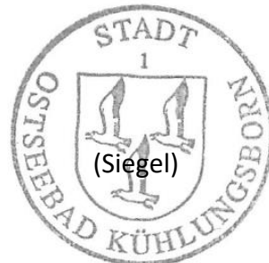
Rüdiger Kozyan Bürgermeister

Einen Übersichtsplan über das Plangebiet befindet sich in der Anlage.