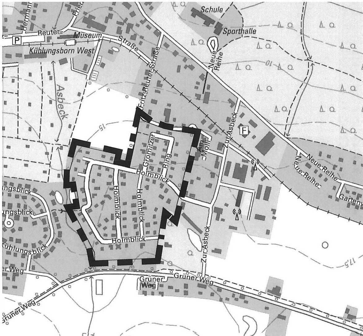
Auszug aus der topographischen Karte

Geltungsbereich der Satzung über die 4. Änderung des Bebauungsplanes Nr. 10 Wohngebiet "Holmblick"